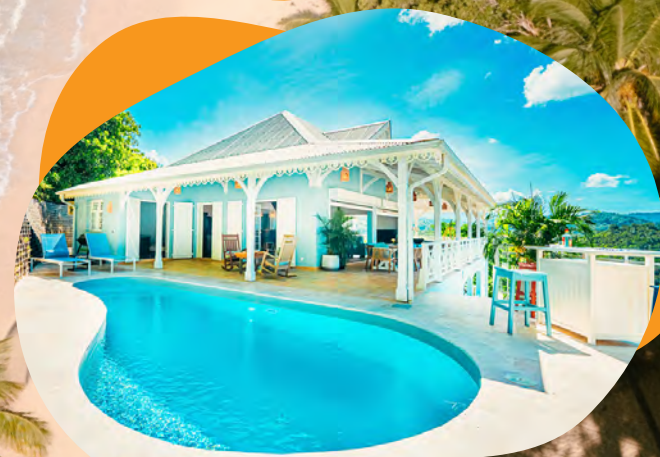
Villas Hotel Bambou