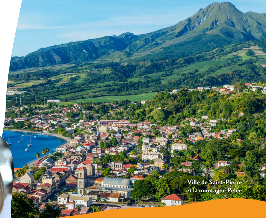
Ville de Saint-Pierre et la montagne Pelée