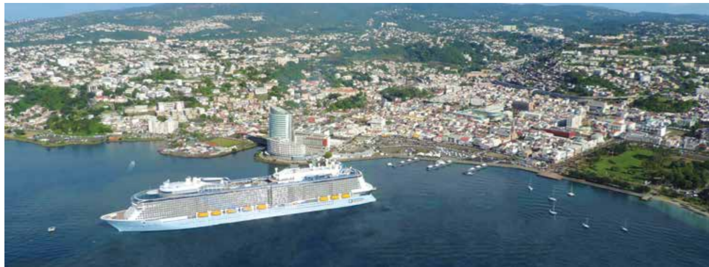
Baie de Fort de France