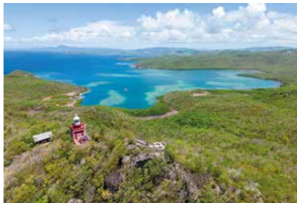
Presqu'île de la Caravelle / Tartane / Martinique