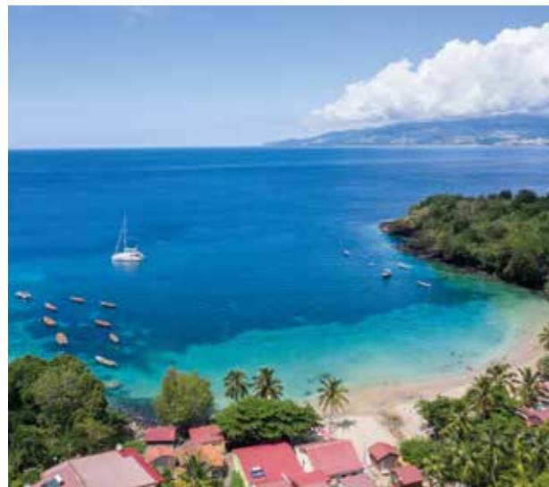
Anse Dufour, Martinique