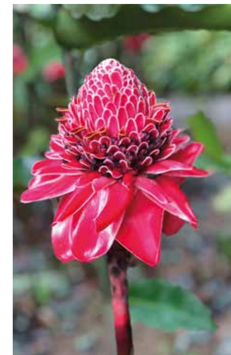
Rose de porcelaine

Ecolibry valorise les richesses naturelles de la Martinique en proposant des expériences de glamping (camping glamour) avec des hébergements insolites tels que la tente inuit et la tente suspendue pour les plus aventuriers, sur différents sites d'exception au cœur des jardins créoles ou au bord de la rivière. Ce glamping offre un hébergement insolite et éco responsable qui permet d'être proche de la nature dans un cadre dépaysant.