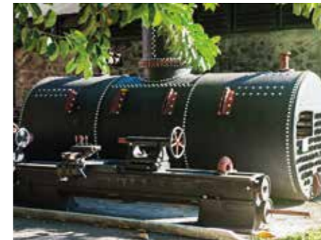
Distillerie Depaz

Rum'Trotters se présente comme la première agence spécialisée en séjours haut-de-gamme proposant des expériences uniques autour de l'univers du rhum tels que séjours dans d'anciennes usines réaménagées en lofts luxueux ou dans une fabuleuse villa, visites privées des distilleries, sorties en catamaran ou ateliers culinaires. www.rumtrotters.com