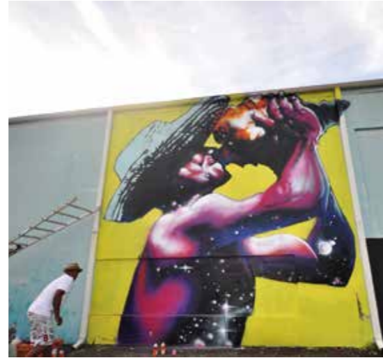
Street Art