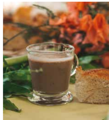
Chocolat et pain au beurre