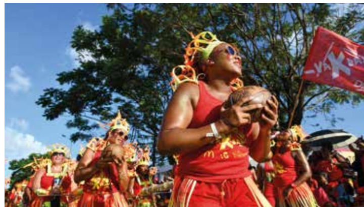
Carnaval / Mardi Gras