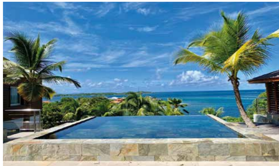
Villa Coralia au François