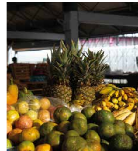
Marché / Fruits