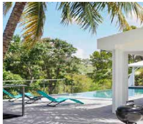
Villa Palm Diamond au Diamant