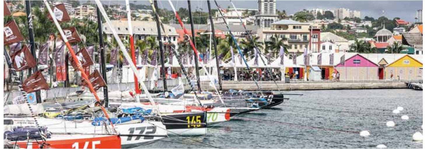
Transat Jacques Vabre 2021-Fort-de-France

Habituellement, la Martinique accueille plus de 10 événements nautiques phares chaque année, avec notamment : la Martinique Cata Raid (en janvier), la Round Martinique Regatta et la Semaine nautique de Schœlcher (en février), le Tour de Martinique des Yoles Rondes (en juillet) et la Martinik Cup Caraïbe (en novembre). Cette nouvelle saison s'annonce tout aussi particulière. En 2023, la Martinique accueillera pour la seconde fois consécutive l'arrivée de la Transat Jacques-Vabre , à Fort-de-France, dans le cadre de son 30ème anniversaire. La nouvelle transatlantique Retour à la Base sera une course en solitaire qui s'élancera en novembre 2023 depuis la Martinique, une étape importante pour la qualification au Vendée Globe de 2024, avant de rejoindre Lorient. La nouvelle régata « Cap Martinique » , course transatlantique éco-responsable 100 % amateurs et sans escale, qui s'est tenue en mai 2022 avec un départ de la Trinité-sur-Mer (Morbihan) et une arrivée en baie de Fort-de-France.