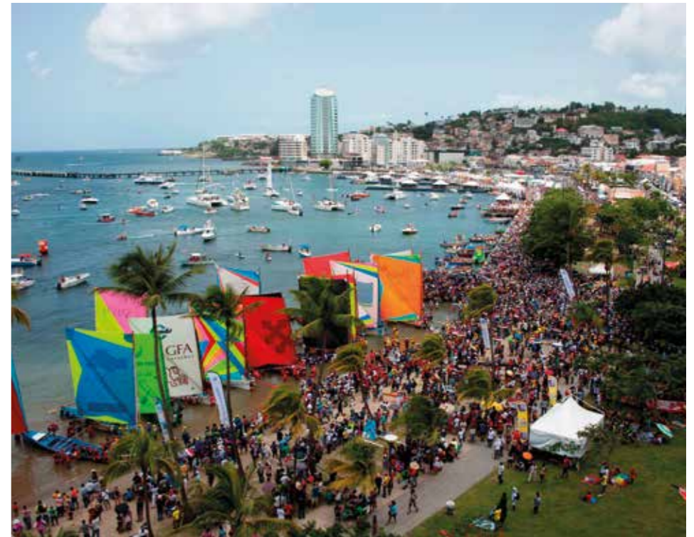
Yoles - Fort SL