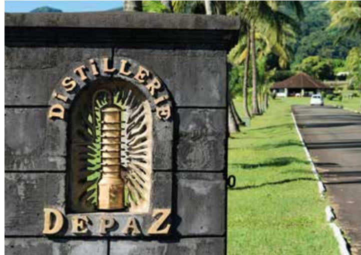
Distillerie Depaz