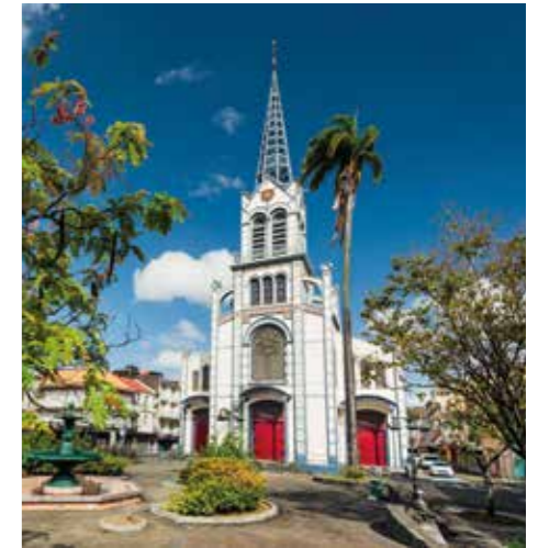
Cathédrale Saint-Louis à Fort-de-France / Architecture ©CMT