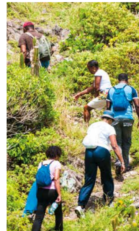
Rando éco

Créé en 2015 en partenariat avec le Comité Martiniquais du Tourisme, le Raid des Alizés - Martinique est chaque année un moment de grandes émotions, de rencontres, de dépassement de soi et de souvenirs inoubliables... Le long d'un parcours, tenu secret jusqu'au jour J, les 75 équipes entièrement féminines participent à différentes épreuves classiques de l'univers des raids multisports (trail, VTT, canoë...) ainsi qu'à de nombreuses épreuves surprises. Chaque année, en novembre.