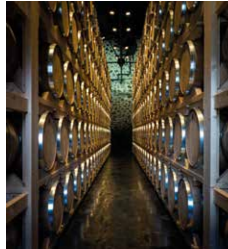
Distillerie / Fûts de rhum