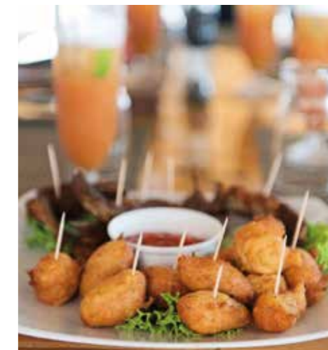
Accras de morue