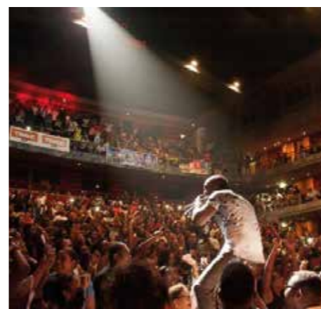
Atrium de Fort de France/ Admiral T en concert - ©CMT

Le Bèlè trouve ses origines dans l'esclavage, période durant laquelle il était interdit aux esclaves de jouer leur propre musique ou de pratiquer leur religion, et s'appuie sur le tambour Bèlè , un vieux tonneau de rhum recouvert d'une peau tendue et sur le ti-bwa , deux baguettes de bois que l'on frappe contre un cylindre de bois creux. S'ajoutent la danse et le chant, souvent liés à des sujets de société. Le bèlè peut se danser seul, en couple ou en quadrille. La Maison du Bèlè à Sainte-Marie propose une exposition permanente autour de l'histoire du Bèlè et organise des cours d'initiation à cette danse. L'Association Mi Mès Manmay Matinik (AM4) célèbre le danmyé-Kalenda-bèlè auprès de 700 adhérents qui font vivre cet art traditionnel de Martinique. Véritable lieu de partage, Lakou A est un espace pédagogique qui permet aux touristes et Martiniquais d'apprendre et de vivre des soirées bèlè.