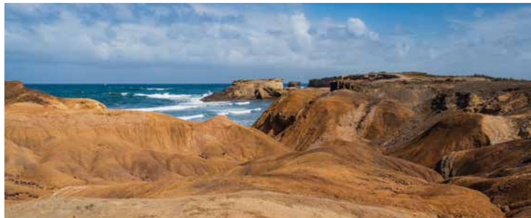
Savane des Pétrifications / Sainte-Anne