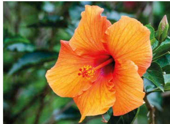
Fleur d'Hibiscus

2/ Des produits cosmétiques naturels qui valorisent les vertus des fruits martiniquais.