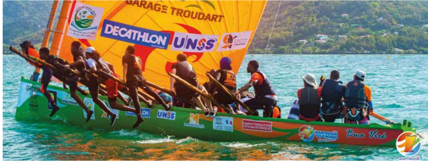
Course de Yoles rondes