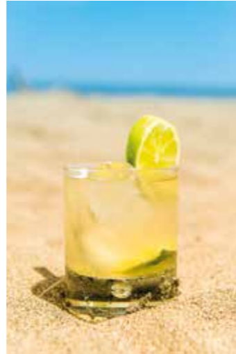
Un Ti punch avec glaçons