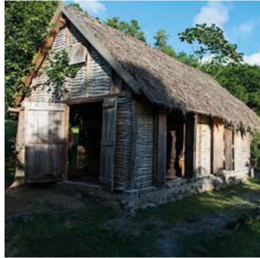
La Savane des esclaves / Trois Îlets