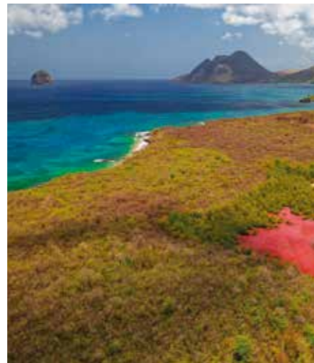
Mangrove du Diamant