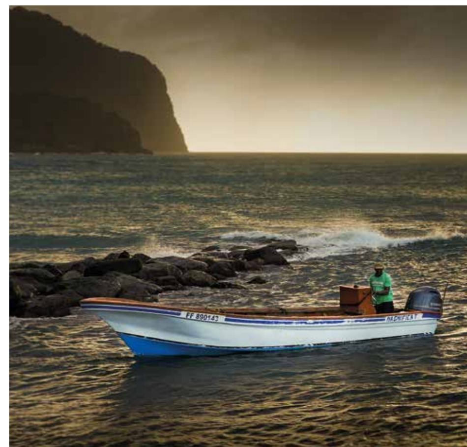
Retour de pêche/ Grand Rivière

« Des temps forts rythment toute l'année avec des fêtes calendaires traditionnelles et des événements culturels uniques ..»