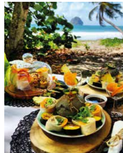
Kalina Event Catering