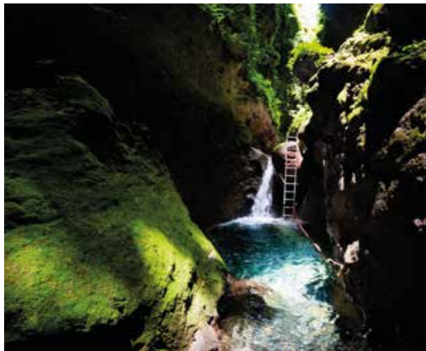
Corges de la Falaise