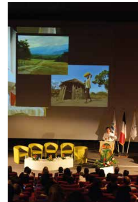
Palais des Congrès de Madiana-Schoelcher