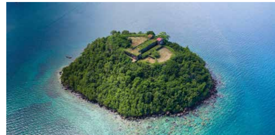
L'îlet à Ramiers