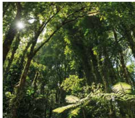
Forêts d'exception UNESCO / Martinique