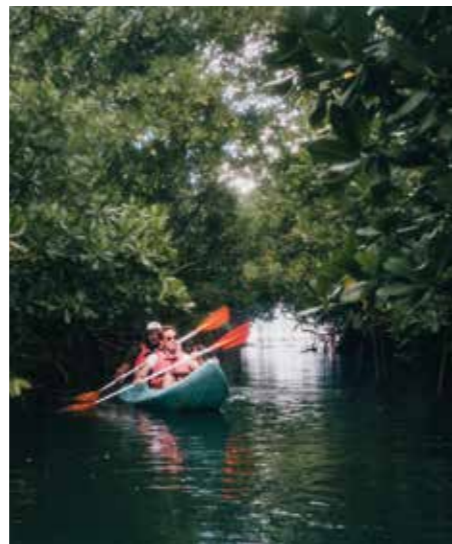
Balade dans la mangrove en Kayak