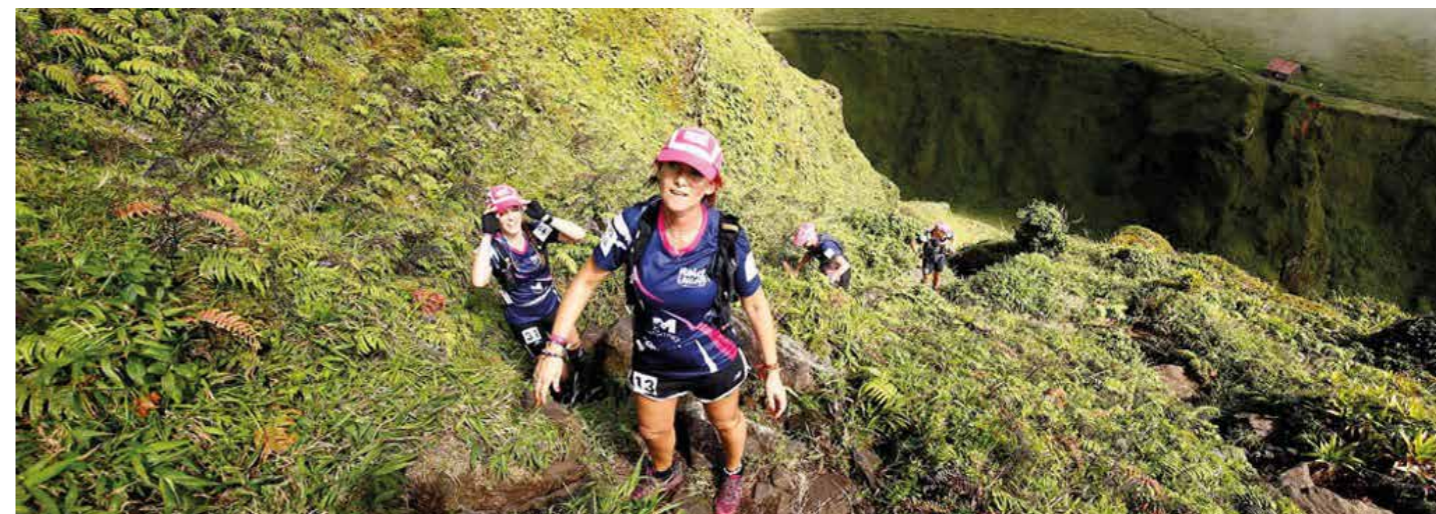
Raid des Alizés / Montagne Pelée