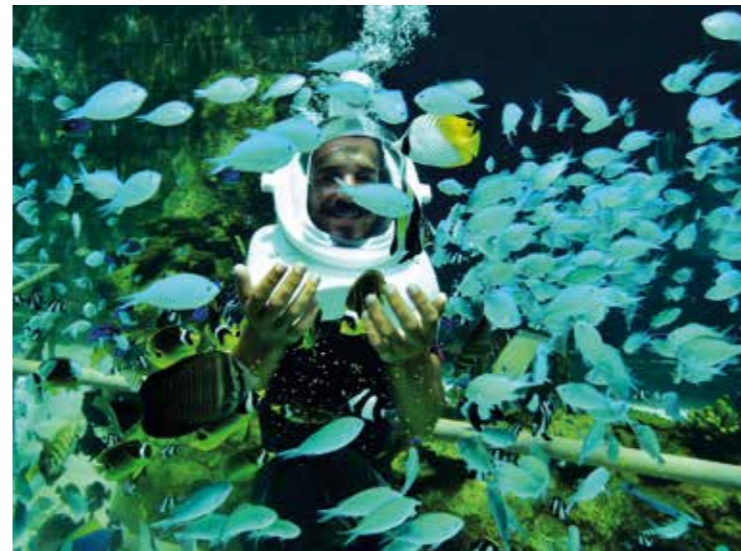
Under sea walking