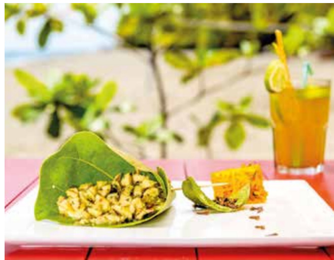
Lambis grillé