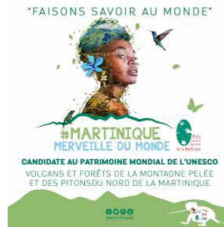
Candidature à l'UNESCO