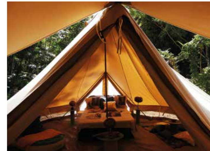
Ecolibry/ glamping