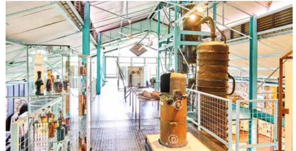
Maison de la Canne aux Trois Îlets