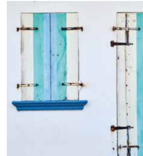
Maison créole / Architecture ©CMT