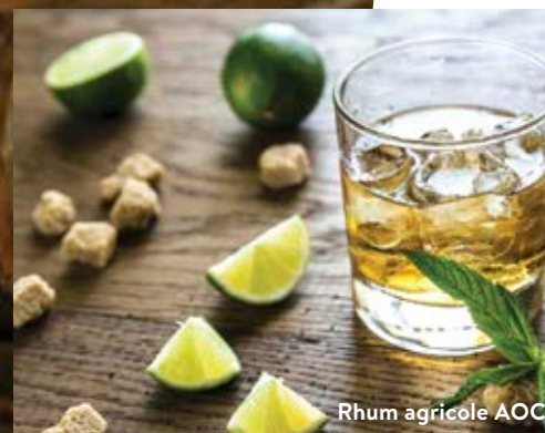
Rhum agricole AOC