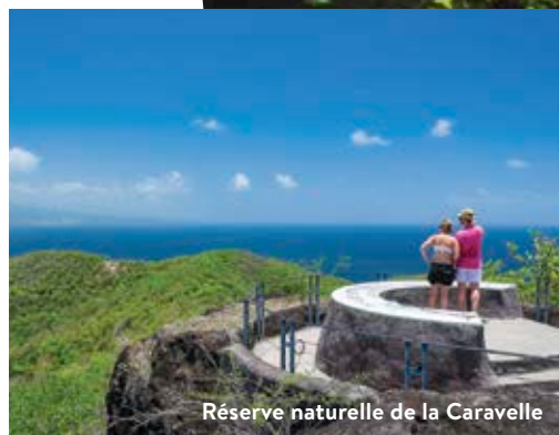
Réserve naturelle de la Caravelle