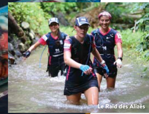
Le Raid des Alizés