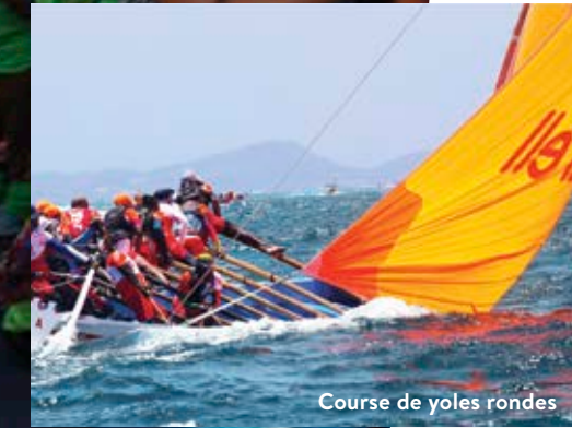
Course de yoles rondes