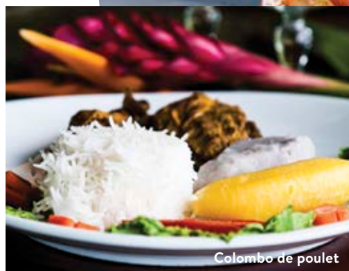
Colombo de poulet