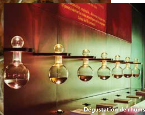
Dégustation de rhums