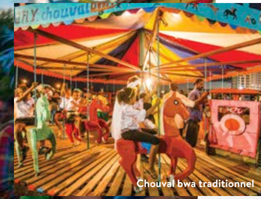
Chouval bwa traditionnel