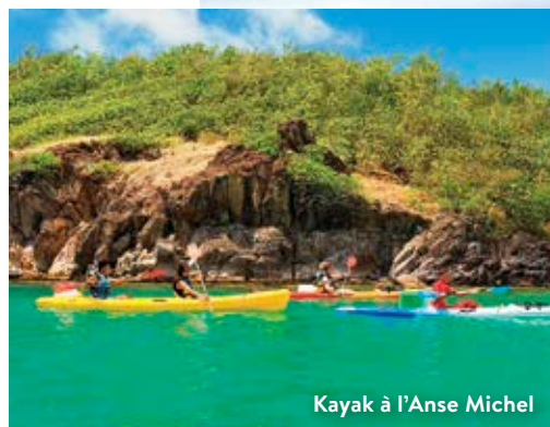
Kayak à l'Anse Michel