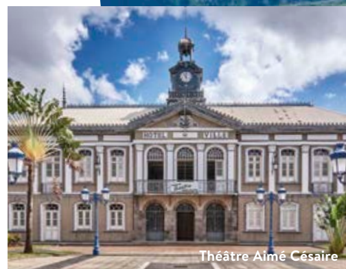
Théâtre Aimé Césaire