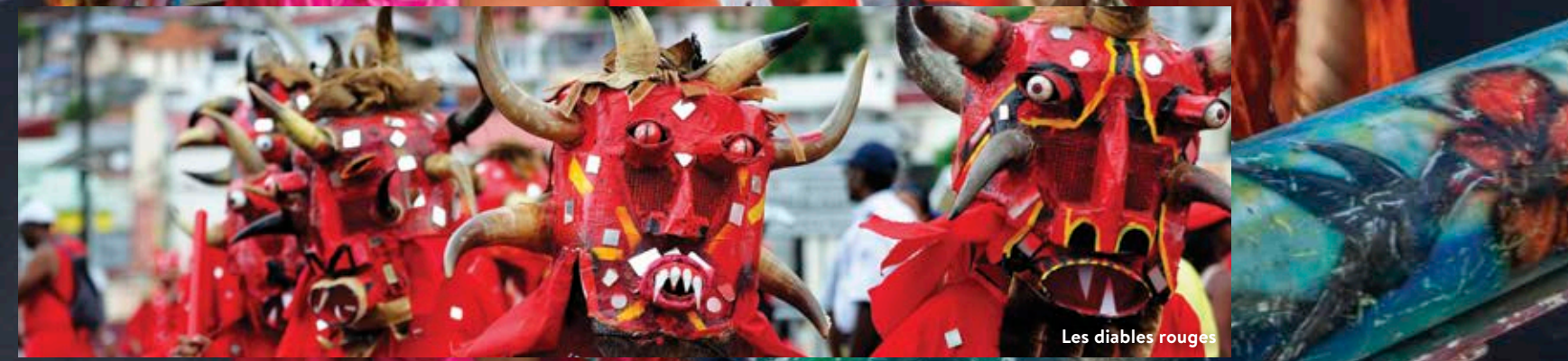
Les diables rouges