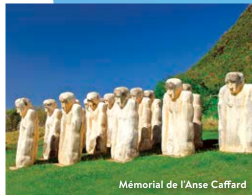
Mémorial de l'Anse Caffard

Devenue officiellement une région de France en 1946, la Martinique arbore aujourd'hui une culture métissée aux accents caribéen et européen, et on trouve partout sur l'île des traces de son histoire fascinante.