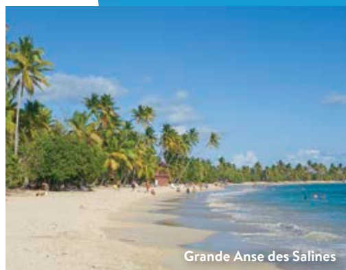
Grande Anse des Salines