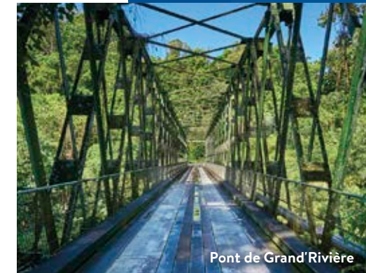
Pont de Grand'Rivière