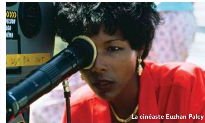
La cinéaste Euzhan Palcy