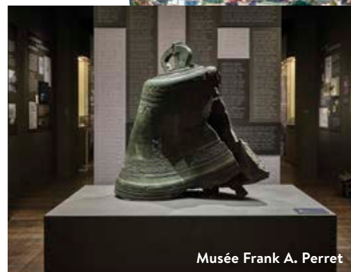
Musée Frank A. Perret