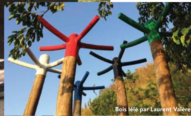
Bois lélé par Laurent Valère