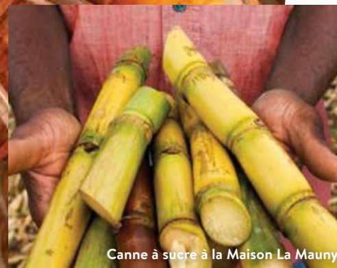
Canne à sucre à la Maison La Mauny