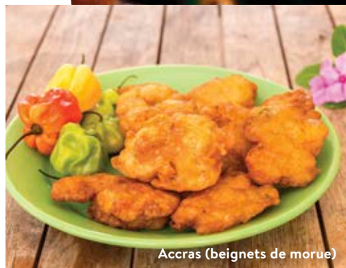
Accras (beignets de morue)

S'il est un amuse-gueule martiniquais par excellence, c'est bien l'accra de morue, un beignet tendre et croustillant, que l'on vend partout et que l'on accompagne d'un ti-punch, un cocktail préparé avec le fameux rhum agricole de l'île.