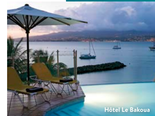
Hôtel Le Bakoua