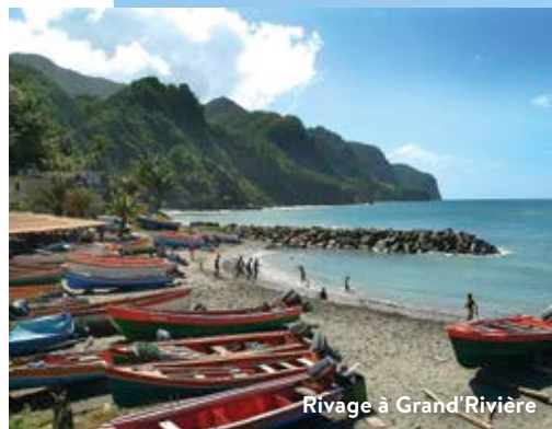
Rivage à Grand'Rivière

Outre la baignade et les bains de soleil, les plages de la Martinique ont beaucoup à offrir, et une multitude de possibilités sont à la portée de ceux qui cherchent à profiter de l'eau : le surf, le surf cerf-volant, la planche à voile et le « Flyboard » sont tous populaires, et la location de matériel est proposée partout sur l'île. En kayak, les amateurs peuvent également se frayer un chemin dans les mangroves ou encore apprendre à manœuvrer une yole, un type d'embarcation unique à la Martinique.