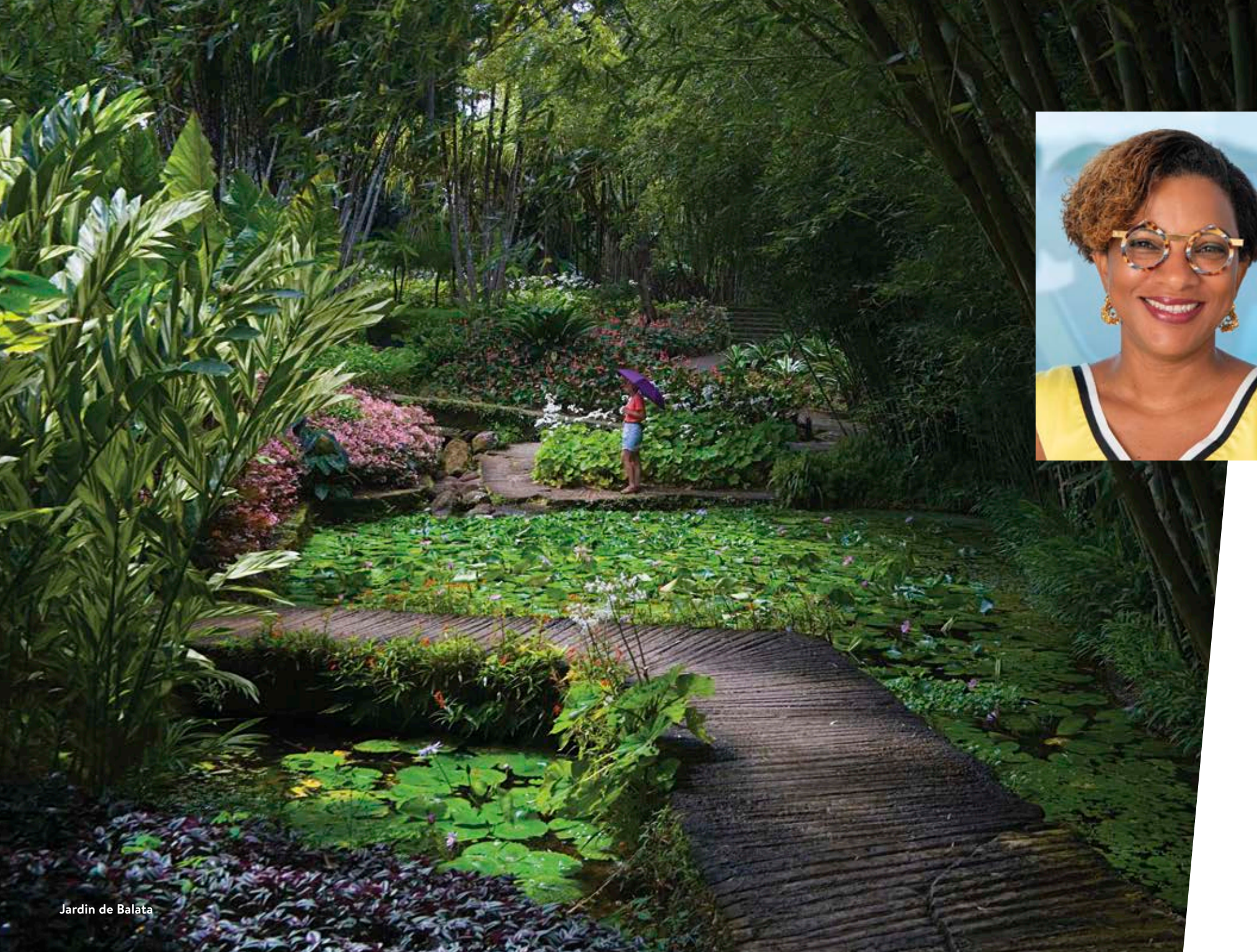
Jardin de Balata