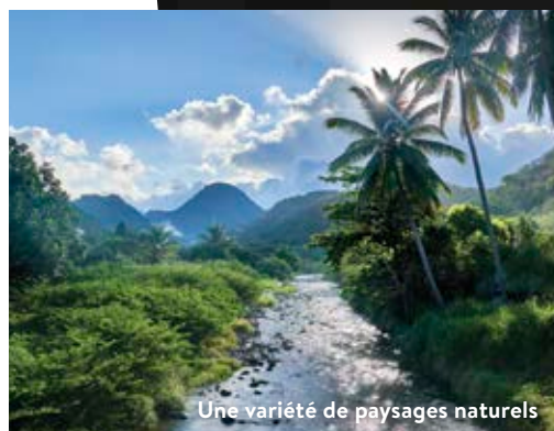
Une variété de paysages naturels